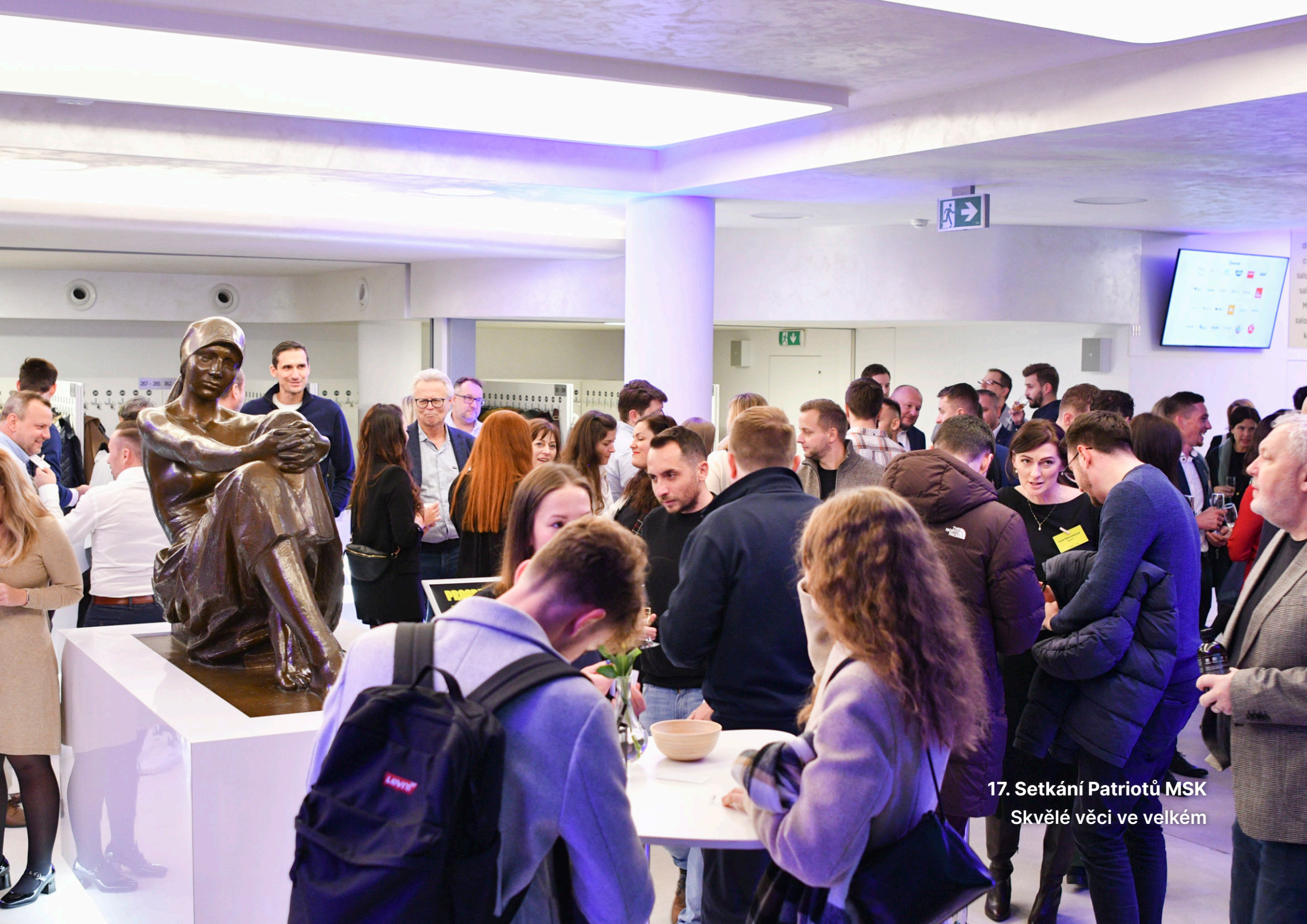
17. Setkání Patriotů MSK Skvělé věci ve velkém