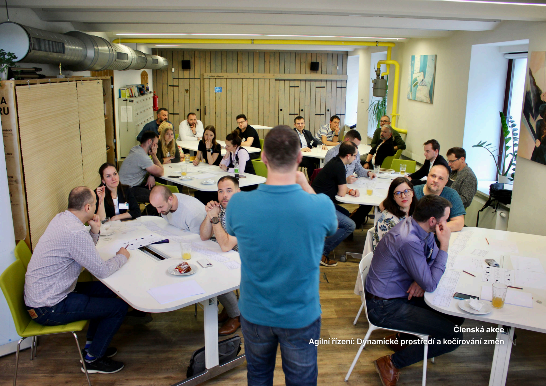
Členská akce Agilní řízení: Dynamické prostředí a kočírování změn