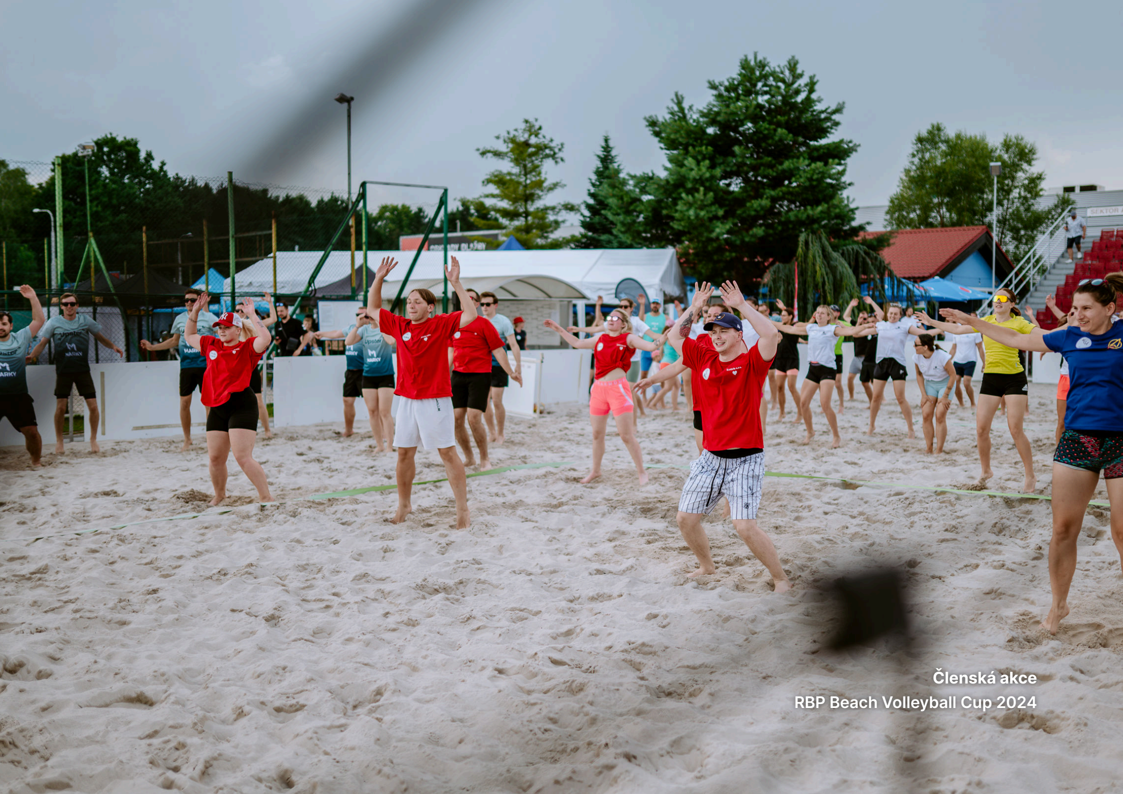
Členská akce RBP Beach Volleyball Cup 2024