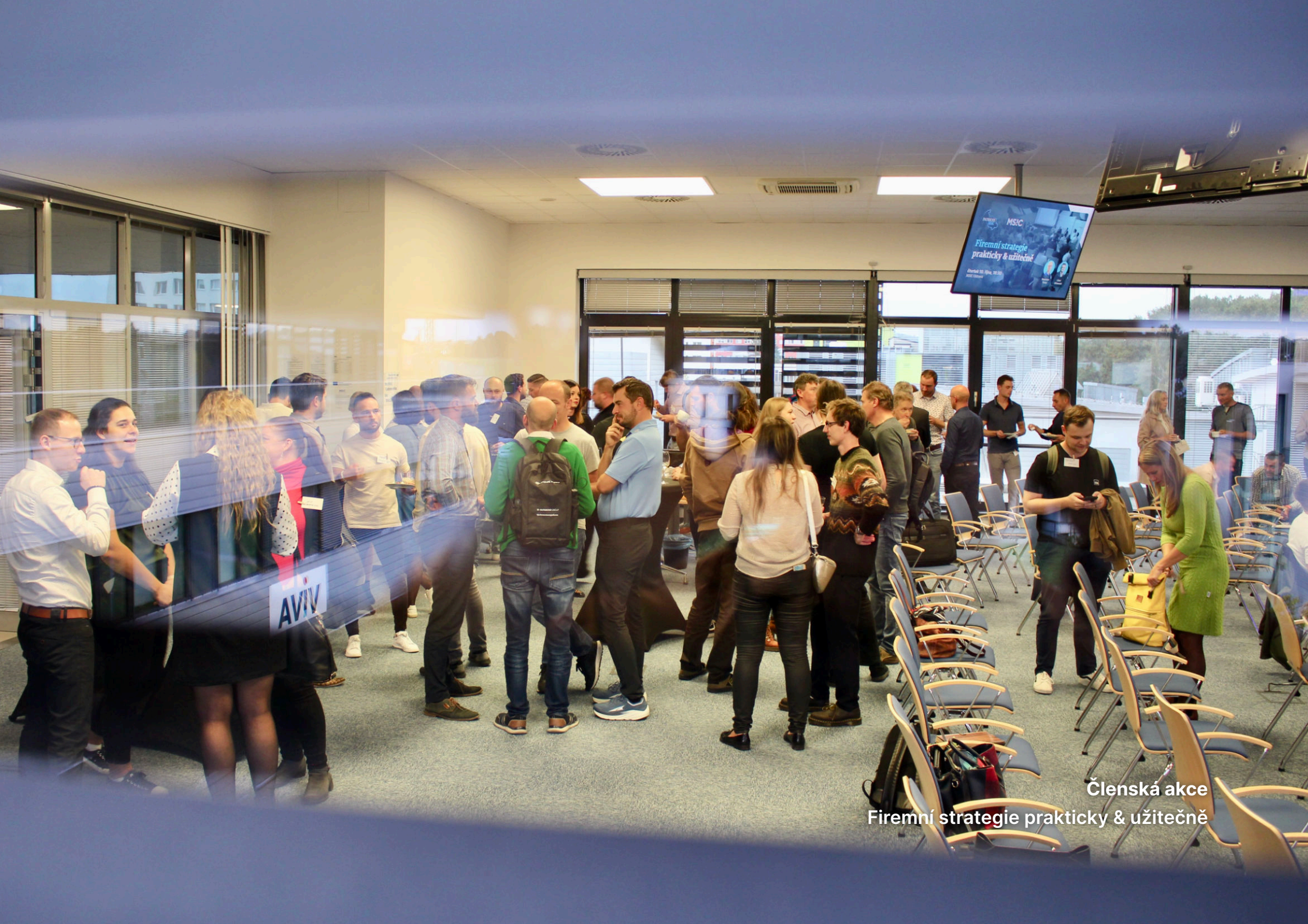
Členská akce Firemní strategie prakticky & užitečně